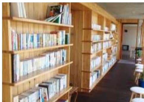
コミュニティライブラリ