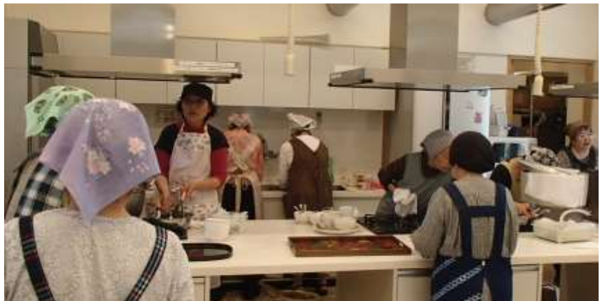
テキパキ調理されるボランティアスタッフのみなさん