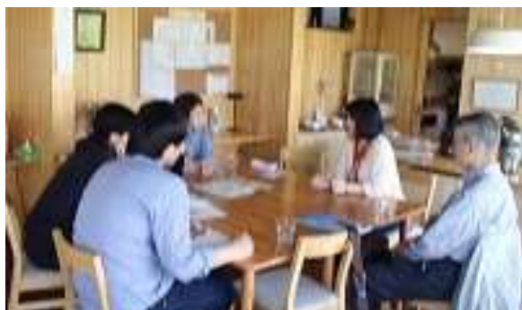
コミュニティ食堂

「ゆいま～る多摩平の森」は、昭和33年に建設された多摩平団地の建物を再生した、多摩平ルネッサンス事業「たまむすびテラス」の一部の、サービス付き高齢者向け住宅とコミュニティハウスです。小規模多機能居宅介護施設や地域開放型コミュニティ食堂を併設しています。