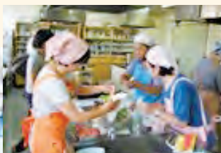
スキルアップ研修 「糖尿病に役立つ調理実習」