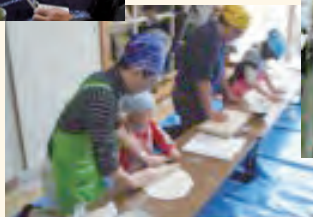
親子deうどんづくり