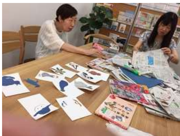
かんたん手作り(新聞ちぎり絵の葉書) (7月のふらっとカフェ)