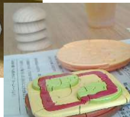
頭の体操(立体パズル) (8月のふらっとカフェ)