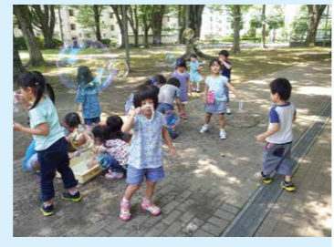
風の子まつり開催 9/20(水) 申込不要 10:00～11:20

昭和42年、国立市が市制施行された頃、富士見台団地の住民たちの手によって幼児教室は誕生しました。以来「思いっきり遊べる元気な子」を目標に、およそ50年間変わらず子どもと大人が一丸となった自主運営の保育に取り組んでいます。